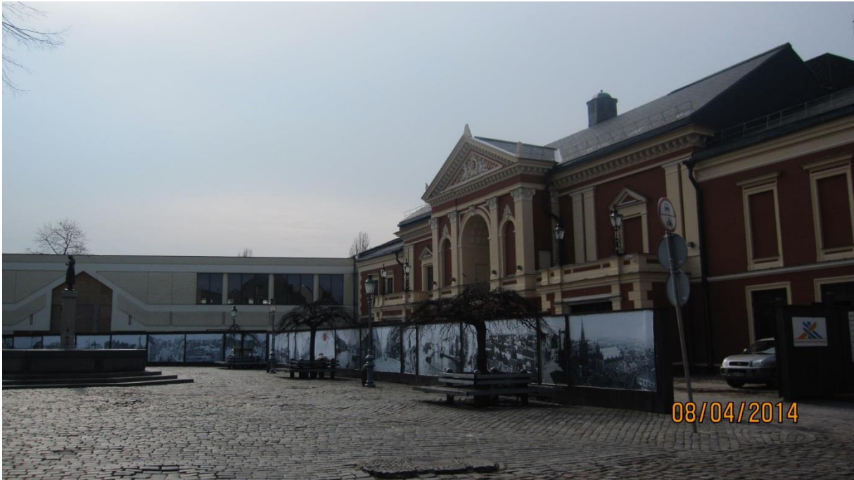
Fot.2. Plac Teatralny na Starym Mieście w Kłapiedzie