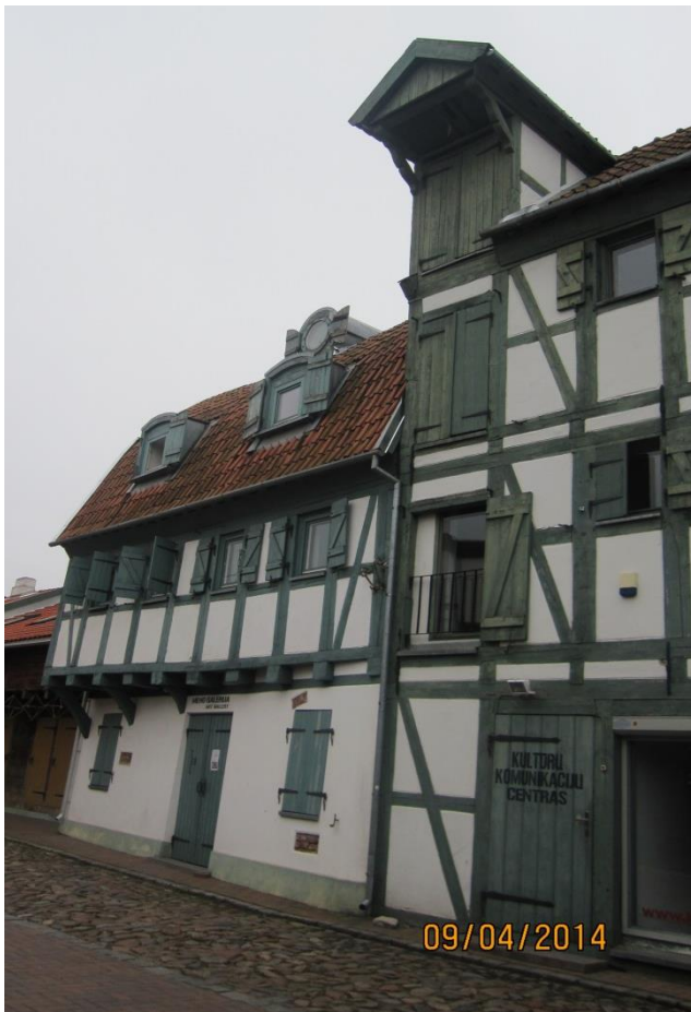
Fot. 8. Centrum Kultury zorganizowane w jednym z najstarszych budynków Klaipėdy