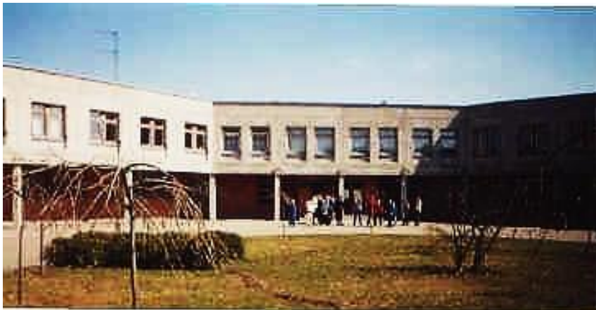
Fot.16. Podwórkó szkolne

Pro-gymnasium w systemie edukacyjnym Litwy jest placówką edukacyjną kształcąca dzieci w wieku 7-14 lat, zbliżoną do szkoły podstawowej w Polsce w systemie sprzed reformy oświaty (mowa o 8-klasowej szkole podstawowej).