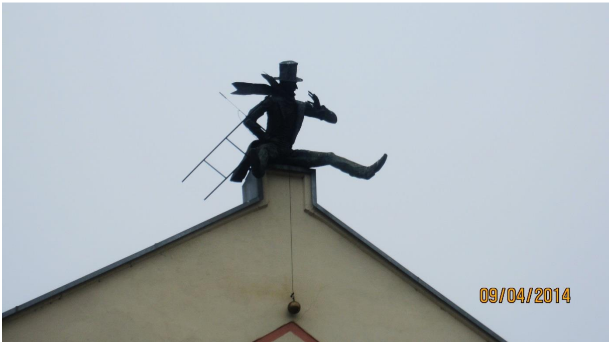
Fot.24. Figura Kominiarza, jako symbolu przynoszącego szczęście mieszkańcom i turystom w Klaipėdzie, na budynku przy ulicy Kurpių 8