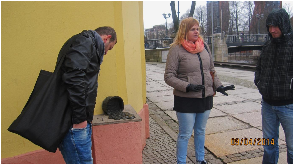
Fot.25. Kosz z międzynarodowymi, historycznymi monetami przy nabrzeżu rzeki Danga, przy budynku pierwszej kasy oszczędnościowej w Klaipėdzie

Zwiedzanie miasta zakończyła miła, integracyjna, wspólna kolacja w jednej z Restauracji przy Palcu Teatralnym.