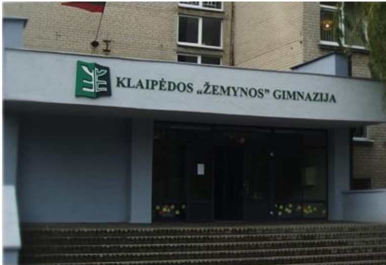
Fot.26. Główne wejście do Gimnazjum