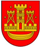
Ryc. 1. Herb miasta Klaipėda