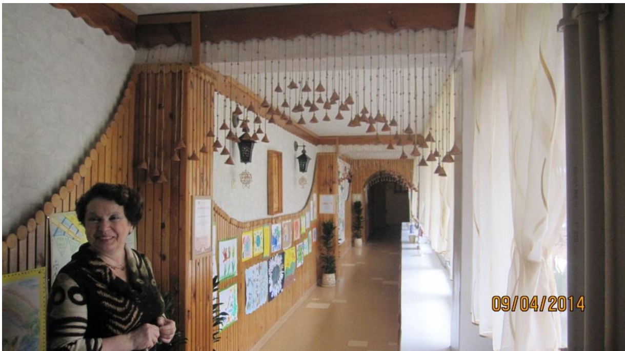
Fot.11. Dyrektor przedszkola demonstrująca dzwoneczki jednej z grup przedszkolnych

Interesujący jest sposób integrowania dzieci z przedszkolem- w pierwszej grupie (2-3 latki) dzieci z pomocą rodziców lepią z gliny i wypalają (przedszkole posiada własny piec garncarski!) dzwoneczki, które wieszają w holach przedszkola. Po zakończeniu edukacji przedszkolnej zabierają swoje dzwoneczki na pamiątkę. W przedszkolu zawsze wisi tyle dzwoneczków, ile dzieci do niego uczęszcza (na zdjęciu niżej).