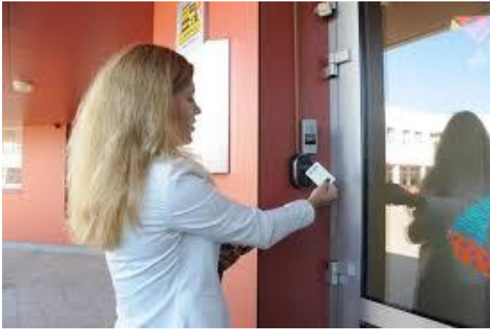
Fot.18. Kadra i uczniowie szkoły posiadają identyfikatory umożliwiające wejście do budynku