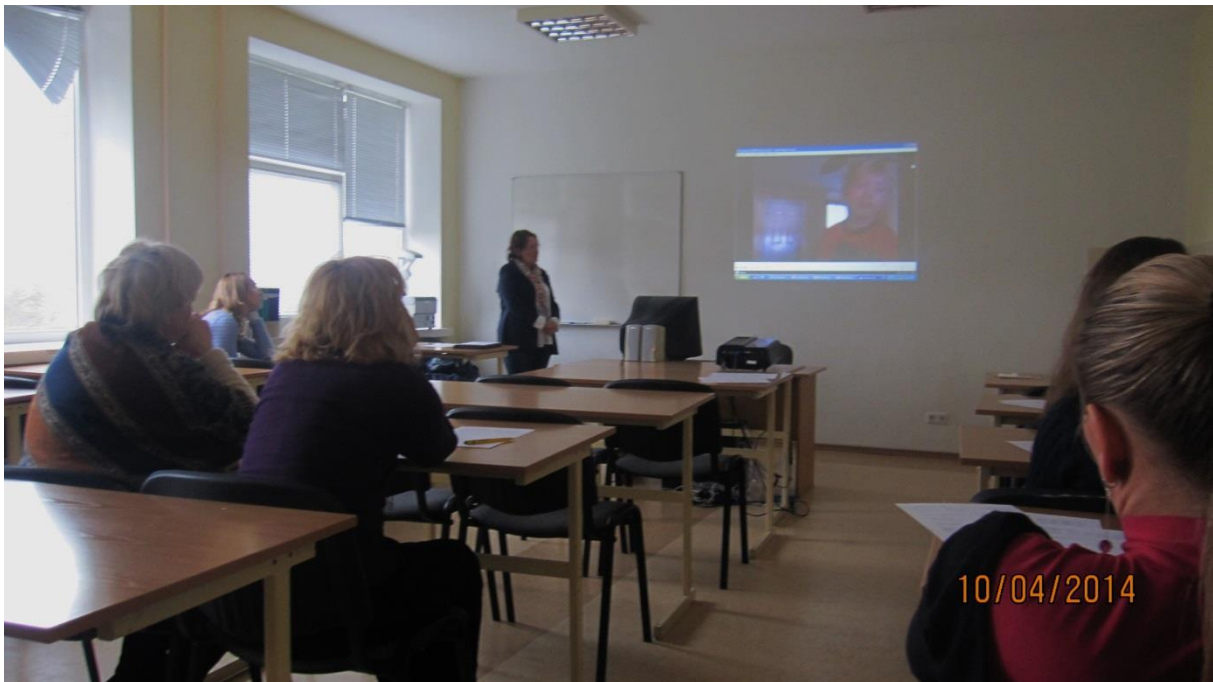
Fot.28. Prezentacja jednego z filmów