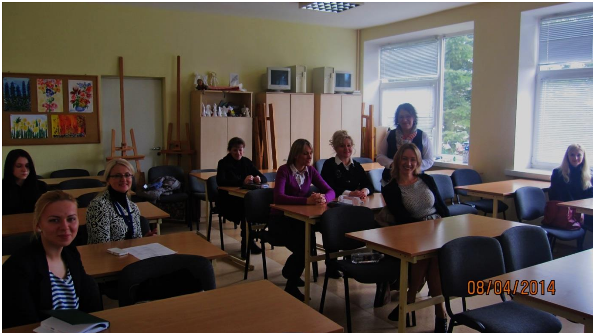
Fot.10. Grupa uczestników zajęć w dniu 8 kwietnia 2014 roku.

Zajęcia dydaktyczne w tym dniu trwały od godz. 10.20 do 12.50 (trzy jednostki dydaktyczne). Tematem pierwszej części zajęć było: Features of typical development achievements of children aged 3-7 years vs Early symptoms of ADHD and Asperger Syndrome . Miała ona charakter interaktywnego wykładu , wzbogaconego materiałem audowizualnym, zawierającym kazusy dzieci z poszczególnymi typami zaburzeń. Integralną częścią zajęć była dyskusja o praktykach diagnostycznych, stosowanych w krajach partnerów oraz o skali występowania zaburzeń u dzieci.