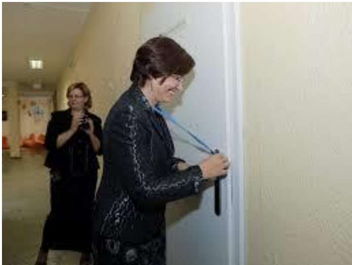
Fot.19. Podobne identyfikatory otwierają drzwi pracowni i „sprawdzają obecność” uczniów wchodzących na lekcję

Ciekawostką, wobec toczących się w Polsce dyskusji o darmowych podręcznikach szkolnych, jest fakt, że finansowania przez rząd Litwy podstawowych podręczników dla uczniów wszystkich typów szkół. Rodzice ponoszą koszt ćwiczeń i innych materiałów uzupełniających.