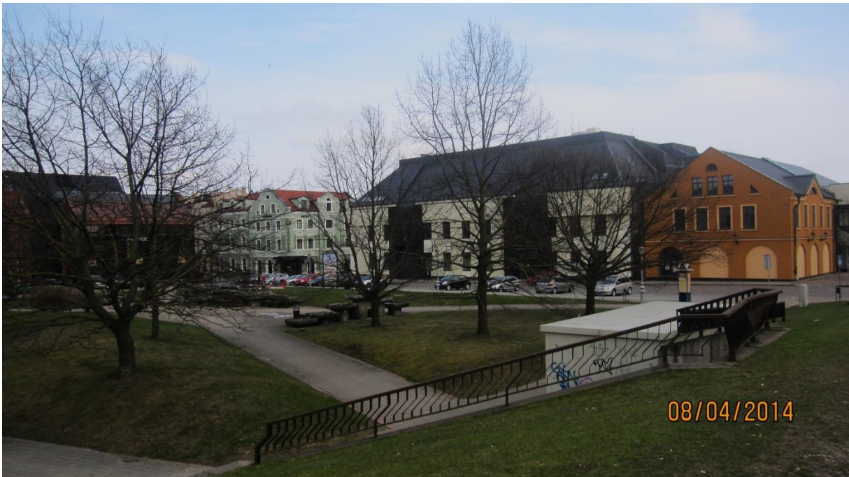
Fot.3. Prawy brzeg rzeki Danga