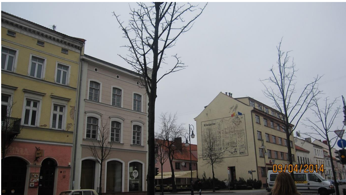
Fot.23. Mapa miasta Klaipėda na ścianie budynku przy ulicy Tillu