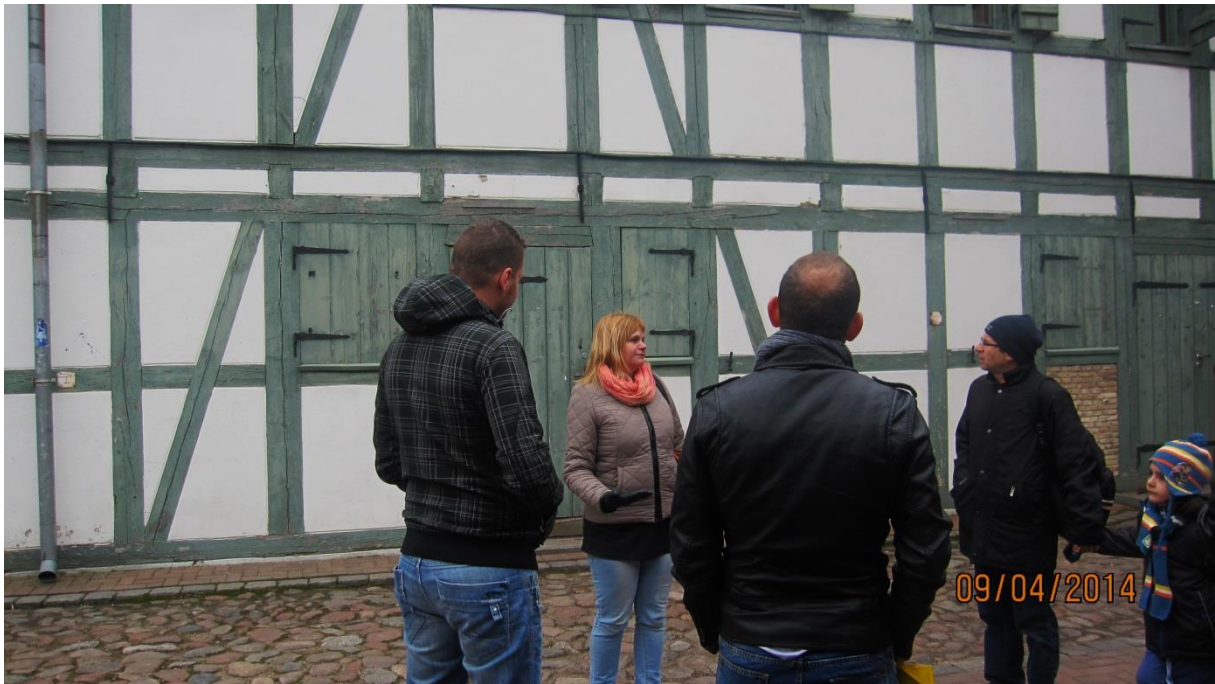
Fot.20. Centrum Kultury