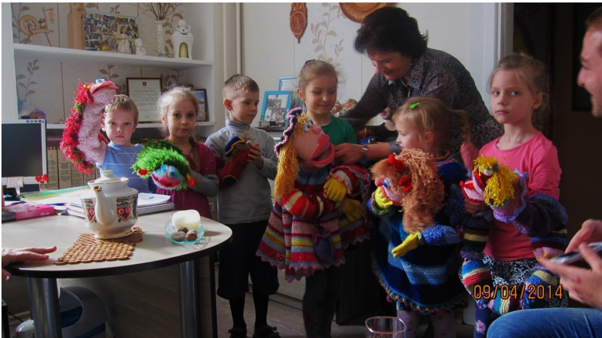
Fot.15. Grupa teatralna z mini przedstawieniem

Dzieci z różnych grup działają w Teatryku Mapeków, co z prawdziwą dumą zaprezentowały.