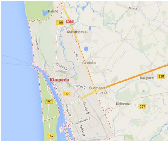
Ryc.2 Klaipėda na mapie

Jest położone na wybrzeżu Morza Bałtyckiego nad Zalewem Kurońskim, dokładnie przy ujściu rzeki Danga ( w jęz. ang. Dane River , w lit. Danes Upe ) do Zalewu. Posiada także nazwę historyczną, pochodzącą z języka niemieckiego „Memel”.