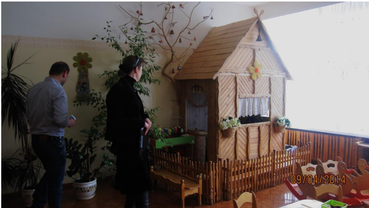
Fot.12. XVII- w. szafa, w której dzieci z jednej z grup mają