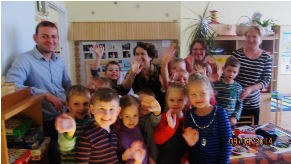
Fot.14. Grupa „starszaków”

Dzieci z różnych grup działają w Teatryku Mapeków, co z prawdziwą dumą zaprezentowały.