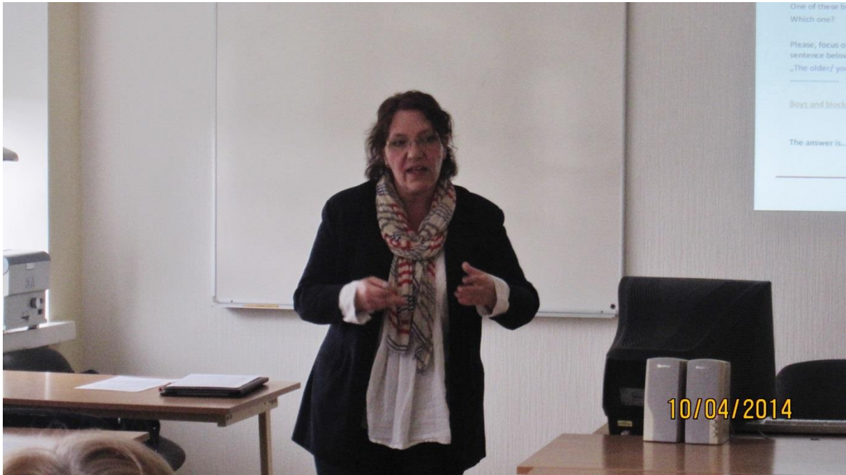
Fot.27. Objaśnianie celów i zadań zajęć

Przebieg zajęć wyraźnie interesował uczestników, co wyrazili w końcowej, ustnej ewaluacji, zwracając także uwagę na „nowe” – szczególnie dla nauczycieli akademickich- umiejętności rozpoznawania symptomów zaburzeń oraz szczególnie ważne dla ich pracy wykorzystanie materiału audiowizualnego w postaci filmów.