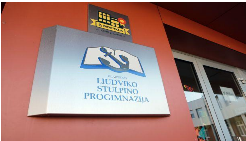
Fot.17. Główne wejście do szkoły

Wizytowana szkoła jest jedną z najnowocześniejszych placówek na Litwie, gdzie działa zintegrowany system elektroniczny (uniwersalna karta magnetyczna), dotyczący bezpieczeństwa uczniów, monitorowania ich osiągnięć, korzystania z zajęć dodatkowych a także opłat za obiady w stołówce szkolnej.