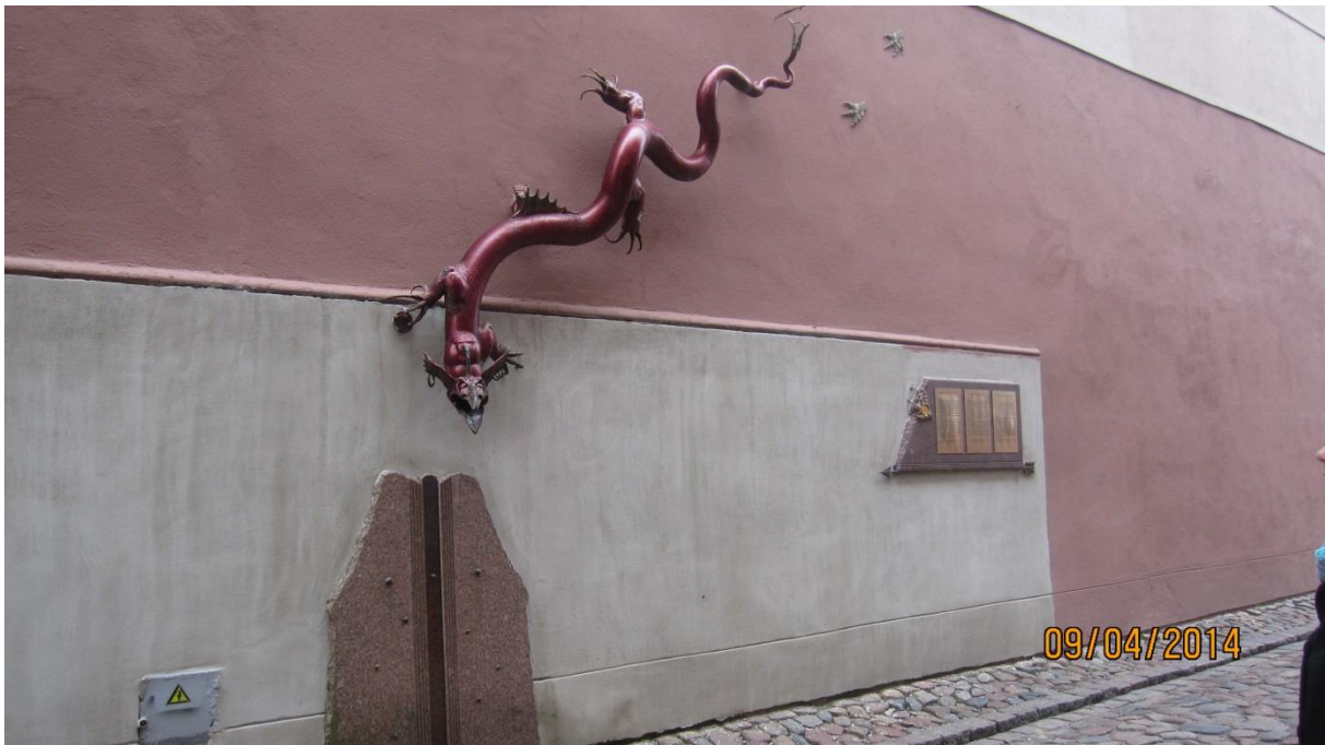
Fot.22. Smok, symbolizujący jedną z legend powstania i dziejów miasta Klaipėda