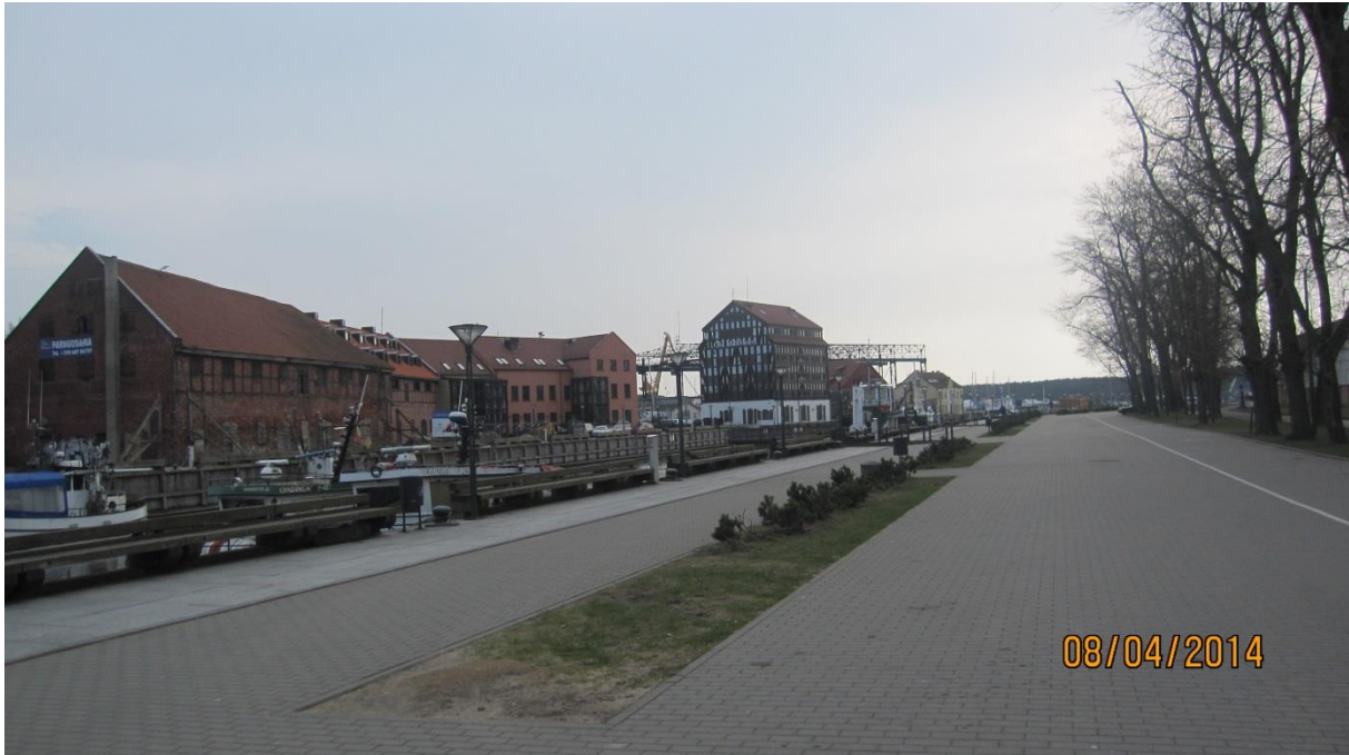
Fot.4. Promenada do Starego Portu Pasażerskiego w Klaipėda