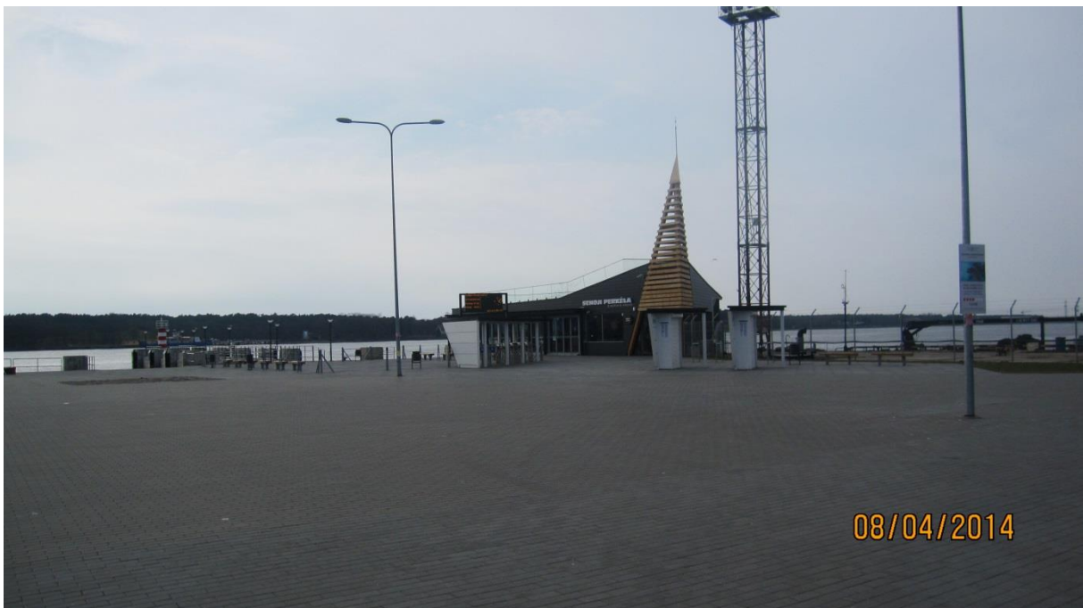
Fot.5. Kasy Starego Portu Pasażerskiego