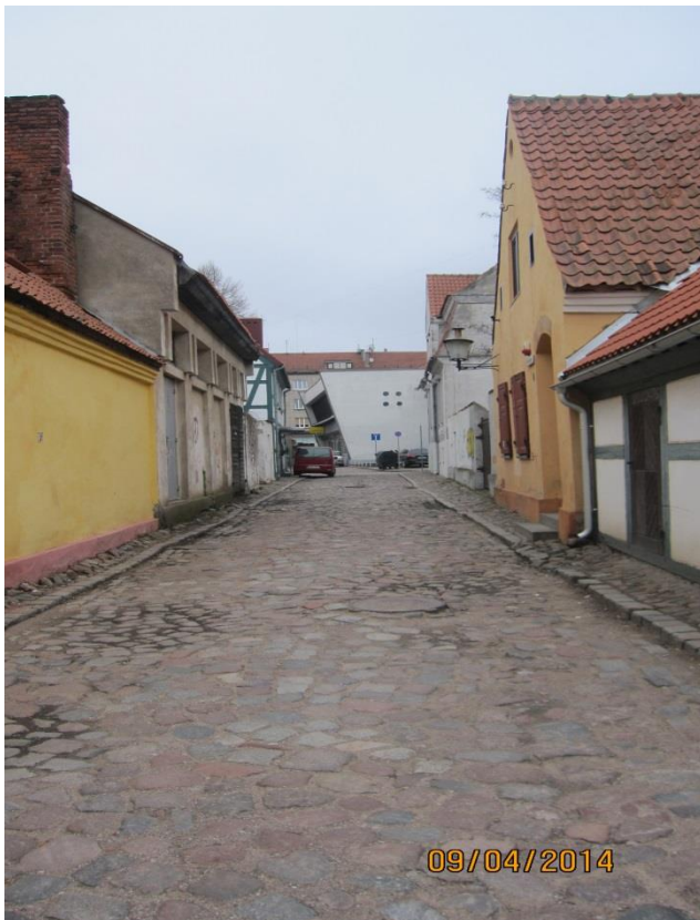
Fot.7. Ulica utworzona w starym korycie rzeki Danga