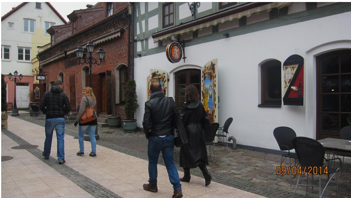
Fot.21. Pasaż gastronomiczny przy ulicy Turgaus