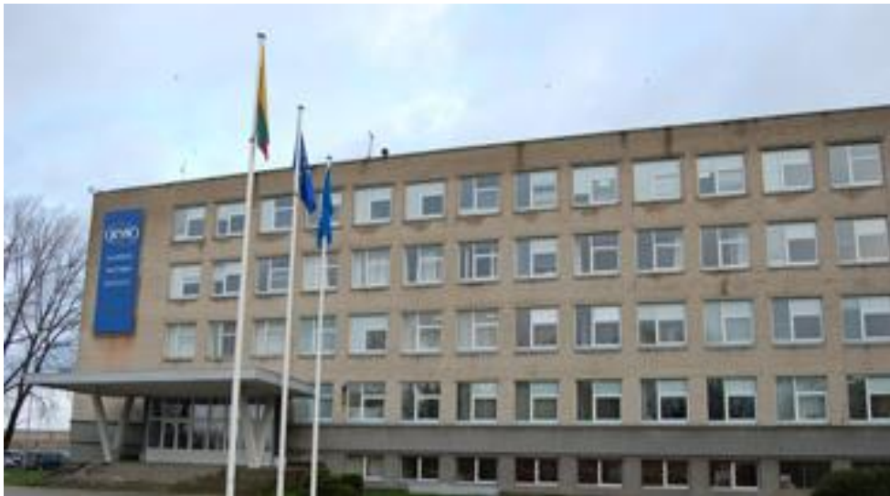
Fot.1. Budynek Wydziału Nauk Społecznych