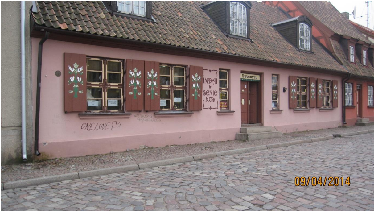
Fot.6. jedna z najstarszych ulic w Klaipėdzie w części Starego Miasta